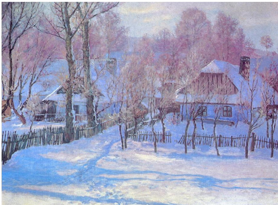
František Kaván: Náves v zimě, olej na plátně, 1908