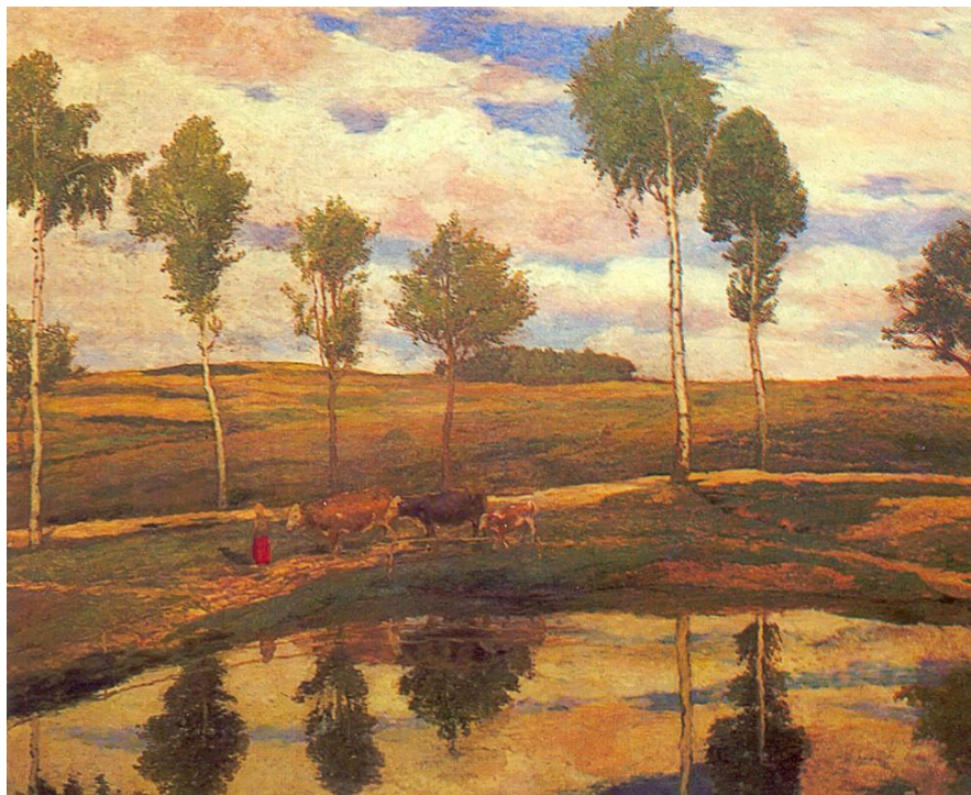
Antonín Slavíček: U nás v Kamenických, olej na plátně, 1904